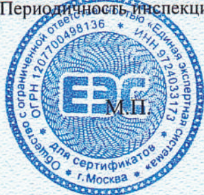
Схема сертификации: 1с. Срок и условия хранения указаны в эксплуатационной документации, приложенной к изделию. Периодичность инспекционного контроля - 1 раз в год.